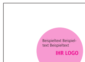
Thematischer Störer, Programmheft Langer Tag der StadtNatur (€ 590,-)