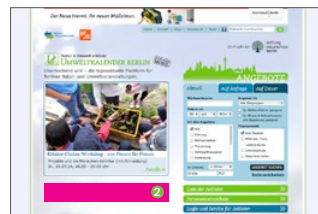
Content Ad Startseite, 476 x 64 Pixel, Rotierendes Banner für 3 Monate* (€ 1200,-)