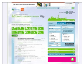
Content Ad Trefferlisten, 400 x 60 Pixel, Rotierendes Banner für 12 Monate (€ 3.300,-)