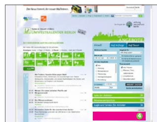
Content Ad Trefferlisten, 400 x 60 Pixel, Rotierendes Banner für 3 Monate* (€ 900,-)